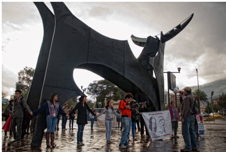
Festejo por la suspensión de la feria taurina de Quito 2012

15 de noviembre de 2012: Se suspende por primera vez desde 1960 (año en el que inició) la feria taurina “Jesús del Gran Poder” de Quito. El enfrentamiento interno del mundo taurino se volvió evidente, con declaraciones y acusaciones de ir y venir sobre el interés económico de los empresarios frente al “espectáculo” que reclaman los aficionados. Los organizadores la suspendieron dicha feria porque la consideraron “empresarialmente inviable”.