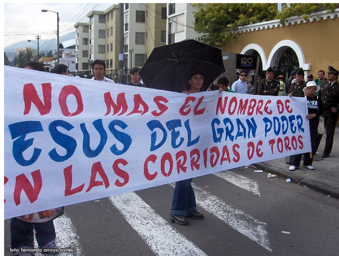
Protestas en las afueras de la plaza de toros Quito - 2006

Años 90 en Quito: Las protestas son regulares cada mes de diciembre y ganan cada vez más adeptos. Sin embargo, no suelen pasar de la confrontación en las afueras de la plaza de toros Quito, y el debate en los medios de comunicación es incipiente.